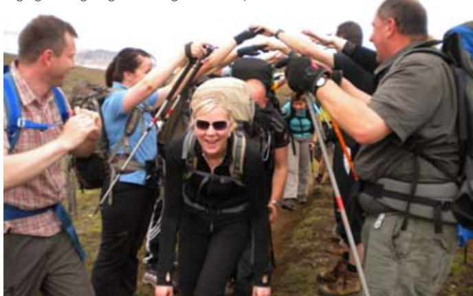
Í gegnum göngin með góðum hópi.