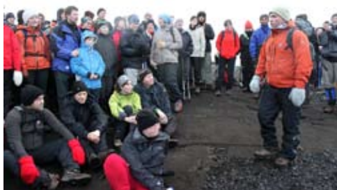
Þátttakendur í fyrstu göngu á tindri Helgafells.

Um áramótin kynnti Ferðafélag Íslands nýtt verkefni í starfi sínu sem hlotið hefur nafnið Eitt fjall á viku, en í verkefninu er markmiðið að ganga á eitt fjall á viku allt árið 2010 eða alls 52 fjöll. Það er framkvæmdastjóri félagsins, Páll Guðmundsson, sem leiðir verkefnið og er fararstjóri í öllum fjallgöngunum. Verkefnið hefur hlotið frábærar viðtökur og alls hafa um 200 manns skráð sig. Nú er skráningu lokið og þegar hafa þátttakendur gengið á fyrstu þrjú fjöllin í verkefninu.