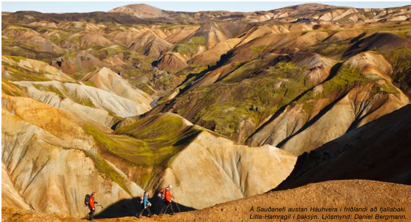
Á Sauðanefi austan Háuhvera í friðlandi að fjallabaki. Litla-Hamragil í baksýn.