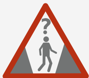
EASY TO GET LOST