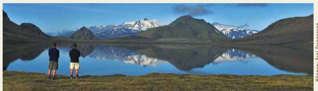
Hönnun: Arni Tryggvason

More informations about other and longer hiking routes conditions and weather are available by rangers and wardens.