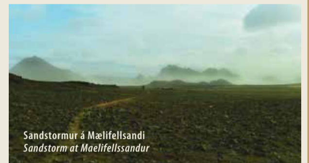
Sandstormur á Mælifellsandur Sandstorm at Mælifellssandur

Walk Laugavegur and cross the bridge over Emstrúa. From there, head east to Entjúkull. A peak that was hidden under a glacier not so long ago is by the foot of the glacier. Sometimes it is unreachable if the river is unpassable. From here there is a beautiful view of the area. The same route is taken on the way back.