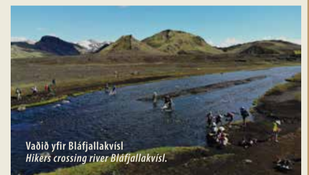
Vaðið yfir Bláfjallakvísl Hiker's crossing river Bláfjallakvísl.

We must work together to minimize the impact on the area and, so it can maintain its value and provide visitors with an enjoyable experience. Please follow the rules.