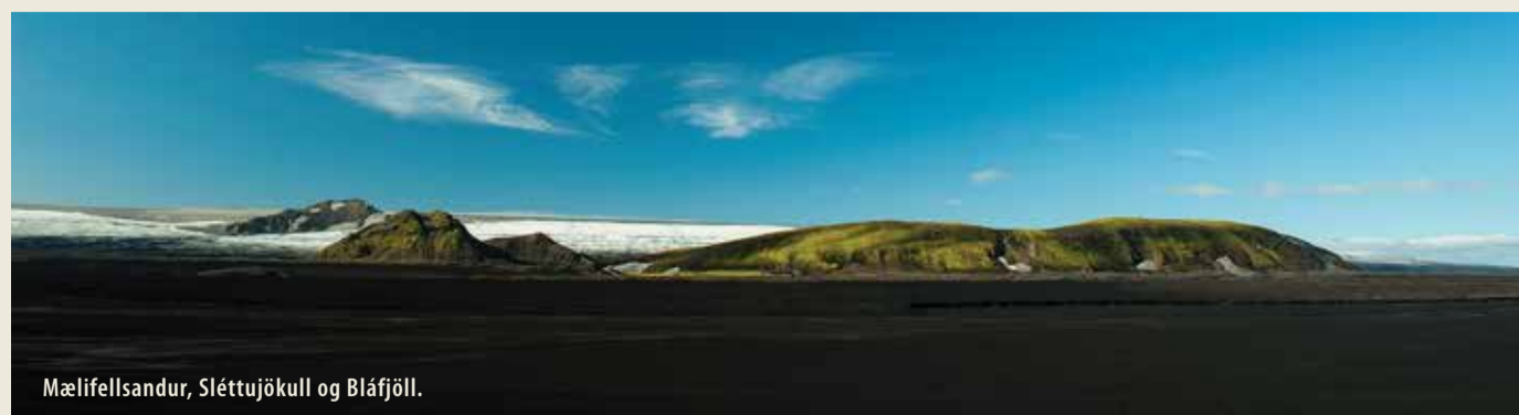
Mælifellsandur, Sléttujökull og Bláfjöll.

Skálaverðir veita upplýsingar um svæðið.