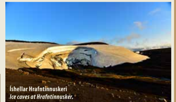
Íshellar Hrafninnuskeri Ice caves at Hrafninnusker.

Skálaverðir eru hér á sumrin og hjá þeim má nálgast frekari fræðslu og upplýsingar um svæðið. Njótið dvalarinnar.