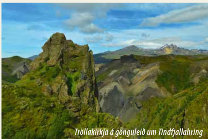
Tröllakirkja á gönguleið um Tindfjallahring

We must work together to minimize the impact on the area and, so it can maintain its value and provide visitors with an enjoyable experience.