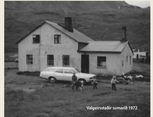
Valgeirsstaðir sumarið 1972